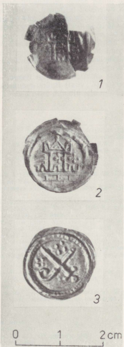
1 tornbrakteaat Pada maa-aluselt kalmistult, 2 tornbrakteaat Kostivere aardest, 3 piiskopibrakteaat Kostivere aardest.