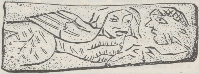
Рис. 1. Костяная пластинка из Тарту.

Вещевой материал этого слоя состоит в основном из гончарной керамики. Больше, чем в верхних напластованиях, здесь найдено фрагментов рейнской посуды. Черепки рейнской керамики встречались как без поливы, так и со светло-серой, светло-коричневой и фиолетово-коричневой поливой. Больше, чем в поздних отложениях, здесь найдено и фрагментов изразцов с зеленой поливой и растительным орнаментом. Из железных предметов найдены гвозди, ножи и их фрагменты, шипы и один наконечник арбалетной стрелы с длинным пером четырехугольного сечения и короткой втулкой. Довольно много собрано костей животных.