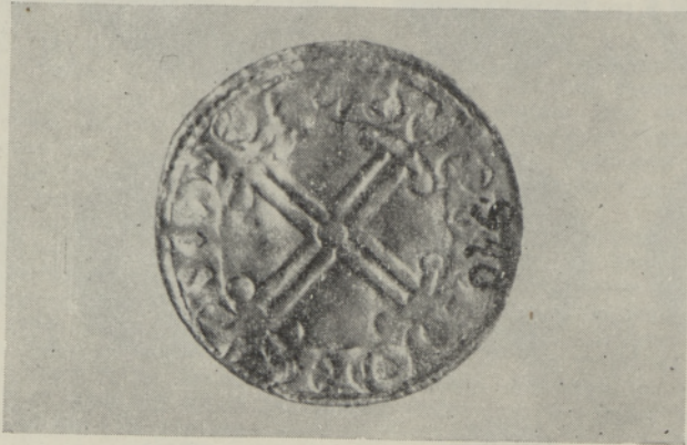
William I penn, 1066. a. (2 : 1).