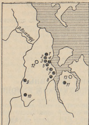
Рис. 1. Распространение курганных могильников вблизи западного побережья Псковского озера: ● — могильники второй половины I тыс. н. э., ○ — могильники не определенного времени. (1—5 — Лаоссина I—V, 6, 7 — Рысна-Сааре I, II, 8 — Сууре-Рысна, 9 — Пуугнитса, 10 — Ярвепя, 11 — Карусааре, 12 — Тоомасмяэ, 13 — Велна).

которых изучались отдельные насыпи, в частности длинные, расположенные в могильниках разной величины и состава (Лаоссина II и V). 3 На основании сопоставления полученных данных с уже имеющимся материалом могильников Линдора, Арнико и Лоози напрашивался вывод, что наиболее древние черты обряда следует искать в могильниках с большим числом длинных насыпей.