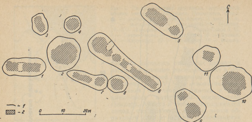
Рис. 3. Могильник Рысна-Сааре II. Обозначения см. в подписи к рис. 2.

произрастающем на песчаной равнине, примерно в 0,6 км западнее Псковского озера. В расположении отдельных насыпей в этом могильнике соблюдения двух параллельных рядов, как в первом, не наблюдается (рис. 3), особенно в его западной части, где курганы возведены беспорядочно. Некоторые различия имеются в величине и внешнем облике насыпей.