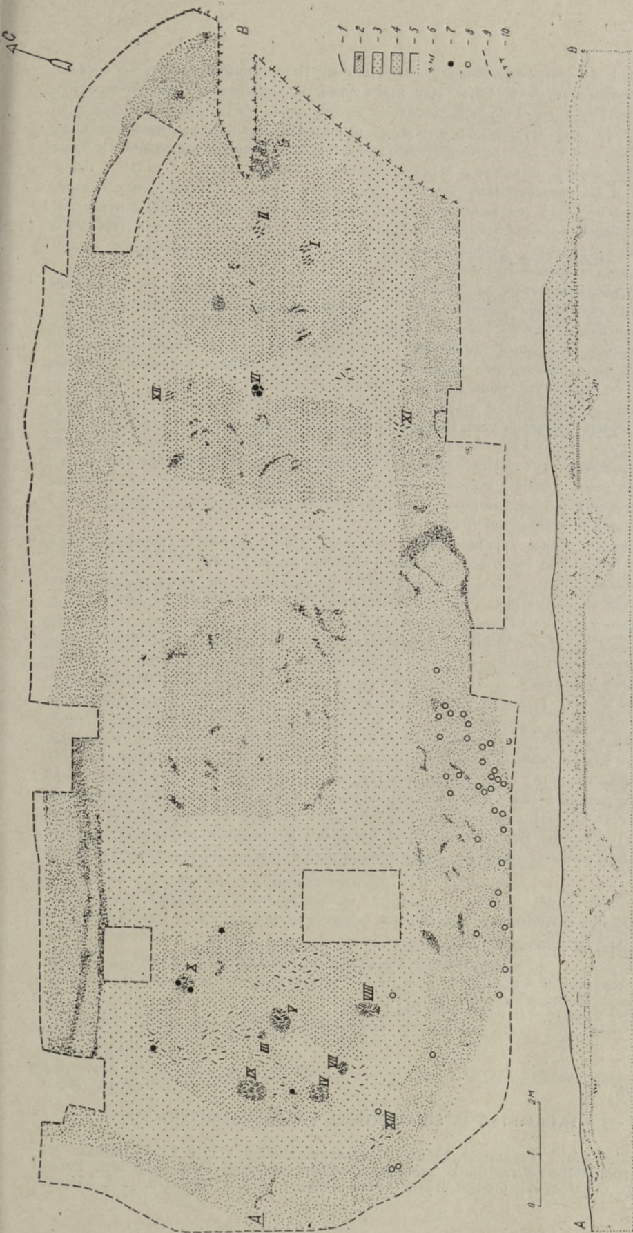
Рис. 2. Сводный план кургана 4 в могильнике Сууре-Рысна. 1 дерн (на разрезе), 2 темный углистый песок, 3 желтый песок насыпи, 4 сероватый песок в основании насыпи, 5 грунтовый желтый песок, 6 сожженные кости, 7 находки, 8 черенки гончарной керамики, 9 граница раскопа, 10 граница разрушенной части.