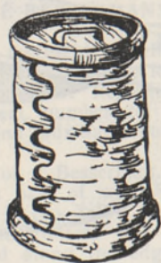
Joon. 3. Kasetohust nõu. Udm. ANSV, Malopurginski raj., Bobja-Utša k. H. Saarnaki joonistus 1980.

valmistatud majapidamisriistu — suurepäraseid rahvadisaini näiteid — ei kasutata enam, nad on ära visatud ja hävima määratud. Ilma suurema vaevata kättesaadav ja praktilisem masstoodang surub arhailise igapäevast elust välja. See on paratamatu ja ülemaailmne protsess.