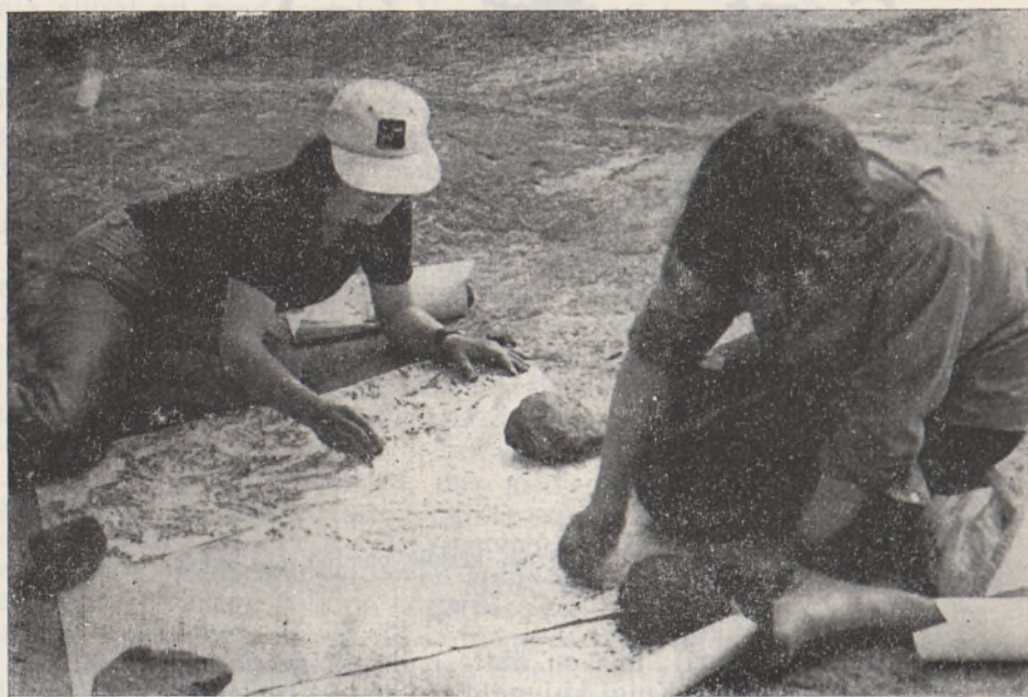
Kaljujoonistest kontaktkoopiate valmistamine. K. Põllu foto 1978.

Valge mere kaljujooniste sisu lahtimõtestamisel on kaks erinevat seisukohta. A. Linevski hüpoteesi kohaselt on neil kujutatud esiajaloolist inimest ümbritsenud tegelikkust. Tema arvates oli jooniste loojate uskumuste alu-