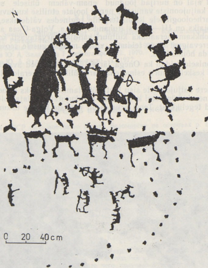
Joon. 3. Uus-Zalavruga 12. grupi keskne pannoo (J. Savvatejevi järgi).

grupp (15 m 2 , 137 figuuri), mis on ühtlasi üks kõige paremini säilinud Valge mere kaljujooniseid. Kuigi kujundid paiknevad tihedalt, ei kata nad üksteist. Arvatakse, et kompositsioon pole rajatud korraga, vaid selle kallal on töötatud pikemat aega, võib-olla isegi mitme põlvkonna vältel (sellele