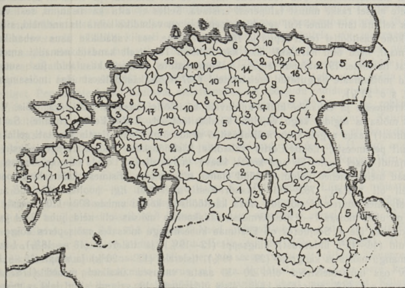
Kaart 1. Vabade käsitöölise arv kihelkonniti 1757. aasta adramaarevisjoni andmeil.

maarahvastikust, samal ajal polnud neid Harju-Madise, Risti, Türi, Lääne-Nigula, Vigala ja Vormsi kihelkonnas ning Hiiumaa kihelkondades 2 protsentigi. Ka Liivimaa kubermangus oli vabu reeglina ikka alla 2 protsendi. Valdava enamiku vabatest moodustasid käsitöölised, kelle harilikult linnas õpitud oskused levisid suuremal või vähemal määral ka maal. Kõik see põhjustaski Põhja-Eesti rahvakultuuri suurema vastuvõtlikkuse ja Lõuna-Eesti rahvakultuuri suurema vastuseisu baltisaksa linnakultuuri mõjudele. Paikkondliku