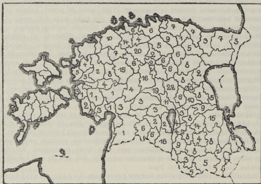
Kaart. 2. Külakäsitööliste arv kihelkonniti 18. sajandi keskel adramaarevisjonide andmeil (Eestimaa kubermangu, eriti Viru- ning Järvamaa osas ei ole andmed täielikud).

oskuste järele. Kus käsitöölisi leidis rohkesti, seal oli harilikult talupoja kodune käsitööoskus väiksem. Kui aga külakäsitöolistest andmeid pole, tähendab see seda, et vastaval alal oli üldisem talupoja kodune käsitööoskus. Näiteks oli külameistrite hulgas alati seppi ja rätsepaid — ilmselt vajas talupoeg nende ametioskusi pidevalt, oma pere oskustega toime ei tulnud. Samas on meil suhteliselt palju teateid kangrustest. Nende oskusi kasutas täiel määral ära mõis, sest talule vajalik riie kooti ikka oma pere jõududega. Lääne-Eestis, eriti aga saartel oli vabadike ja peremeeste hulgas suhteliselt vähe käsitöölisi, ka leidus nendes paikkondades hoopis vähem peresid, kes kandsid käsitööalale osutavat lisanime. Ilmselt oli see seotud talupoegade koduse käsitöö ulatuslikuma levikuga (vt. kaardid 2 ja 3).