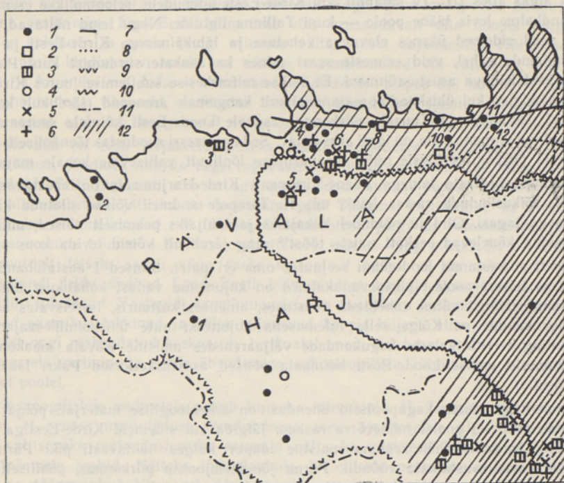
Joon. 2. Loode-Eesti hõimu ala (end. Harjumaa) I aastatuhande algupoolel. Tingmärkide seletus: 1 — kalmeleid (peamiselt kangurkalmeist); 2 — ühe tarandiga kivikalme; 3 — suur tarandikalme; 4 — rooma mündileid; 5 — eesti sarja silmiksõlg; 6 — kirde-eesti tüüpi amb-sõlg; 7 — rannikumurde levikuala lõunapiir; 8 — rannikumurde levikuala muistne lõunapiir; 9 — põhja-eesti keskmurde levikuala edelapiir; 10 — keskmurde tuumala; 11 — muistse maakonna piir XIII saj. algul; 12 — lõikuslaulude levikuala.

lõpust või IV algusest. 43 Kõik mainitud ehted on Kirde-Eestile tüüpilised ning ilmselt koos sisse toodud. Meresõitjatele kuulub ka Valkla erandlik kalme, mis asub tollal paikse asustusega mererannal 44 ning on ajaliselt lähedane Kiiu leiule. Nagu eespool selgitasime, on Lagedi kivikalme 13 tõenäoliselt rajatud Kirde-Eestist tulnud kogukonna poolt. III sajandist alates hakkab teisigi Kirde-Eesti hõimudele tüüpilisi ehteasju ilmuma tänapäeva Harju rajooni idaossa kuni Saha, Iru ja Kurnani. Järgmistel sajanditel on siinsele hõimule omaseid esemeid omakorda levinud Virumaale, eriti lähematele, loodepoolsetele aladele. 45