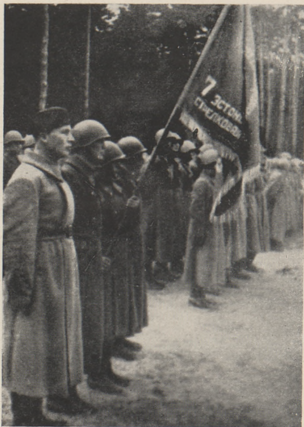
7. eesti laskurdiviisi lippurid äsja saadud lahingulipuga 9. oktoobril 1942.