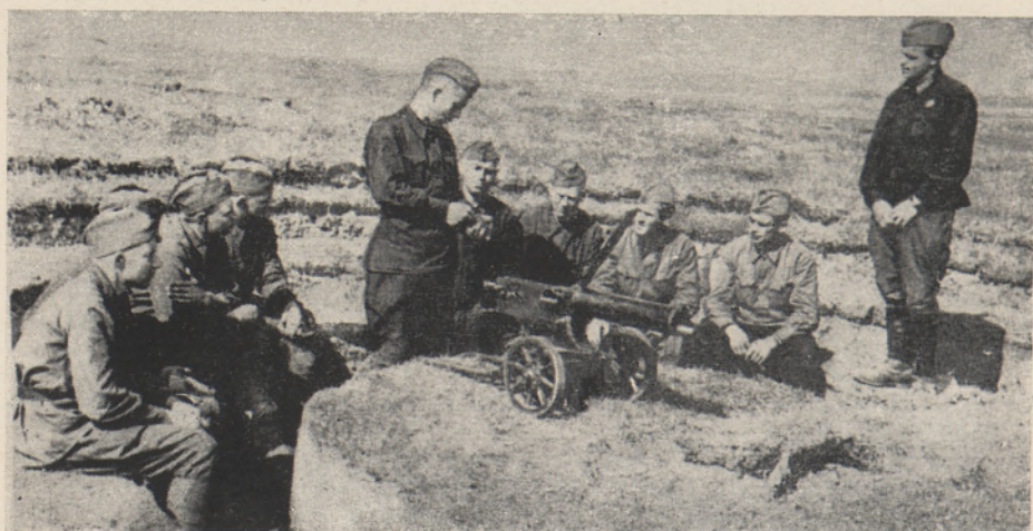
Tagavarapolgu õppepataljoni kursandid tutvuvad raskekuulipildujaga.