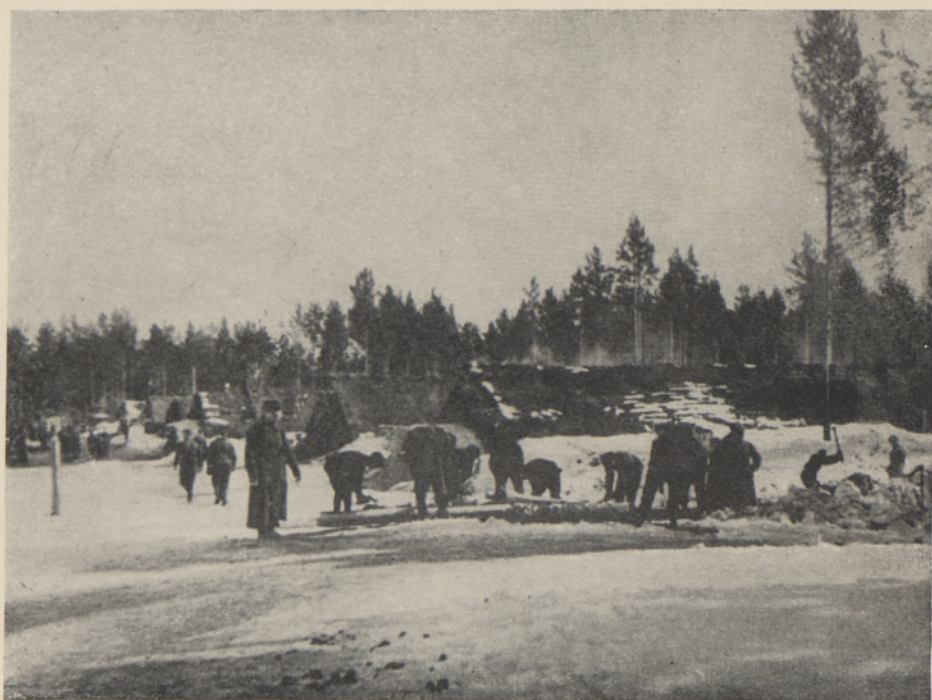
I.aagri korrastustööd 7. eesti laskurdiviisis 1941/42. a. talvel.