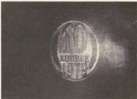
Рис. 2. Мнимое изображение монеты, сфотографированное непосредственно с расположенной в кристате голограммы.