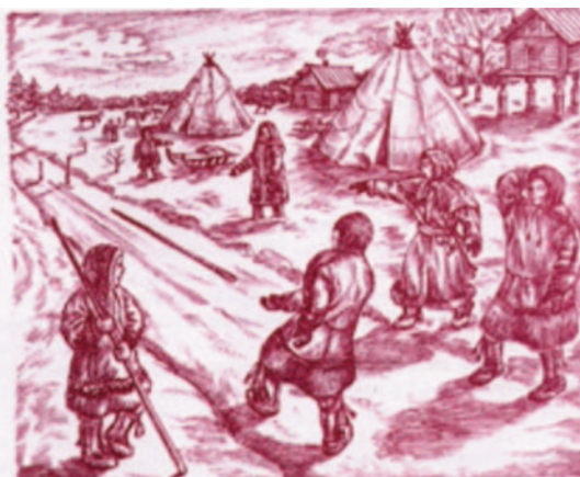
Рис. 7а. То же (Прокопенко 2005 : 247).