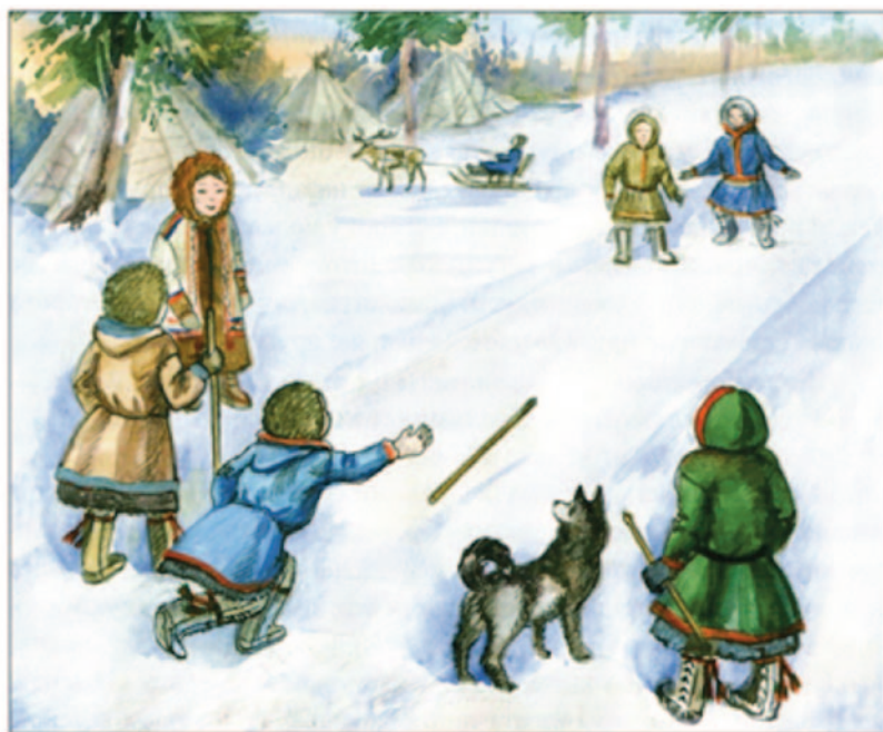
Рис. 3. Иллюстрация к лесной ненецкой игре налля (Прокопенко 2020 : 66).

Описание. Играют два игрока, один против другого. Правила и ход игры те же, что и в первом варианте» (Прокопенко 2020 : 65–67).