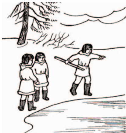
Рис. 7. Хантыйская игра ланть ылпия такта 'броски копья' (Красильников 2002 : 59).