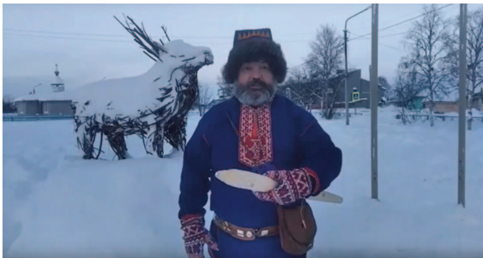
Рис. 5. Ведущий видеоролика об игре нилл чецклэмуш 'бросание копья' в саамской одежде (с. Ловозеро Мурманской обл.).