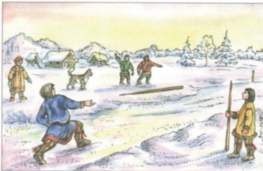
Рис. 4. Иллюстрация к игре «снежная стрела» (Прокопенко 2019 : 69).

2.2. У манси игра с обледелой палкой называется тутнел 'снежная стрела' (Красильников 2004 : 41–42). В. И. Прокопенко указывает, что аналогичная игра известна и хантам (без указания в данном источнике ее аутентичного хантыйского названия) (Прокопенко 2019 : 68–70).