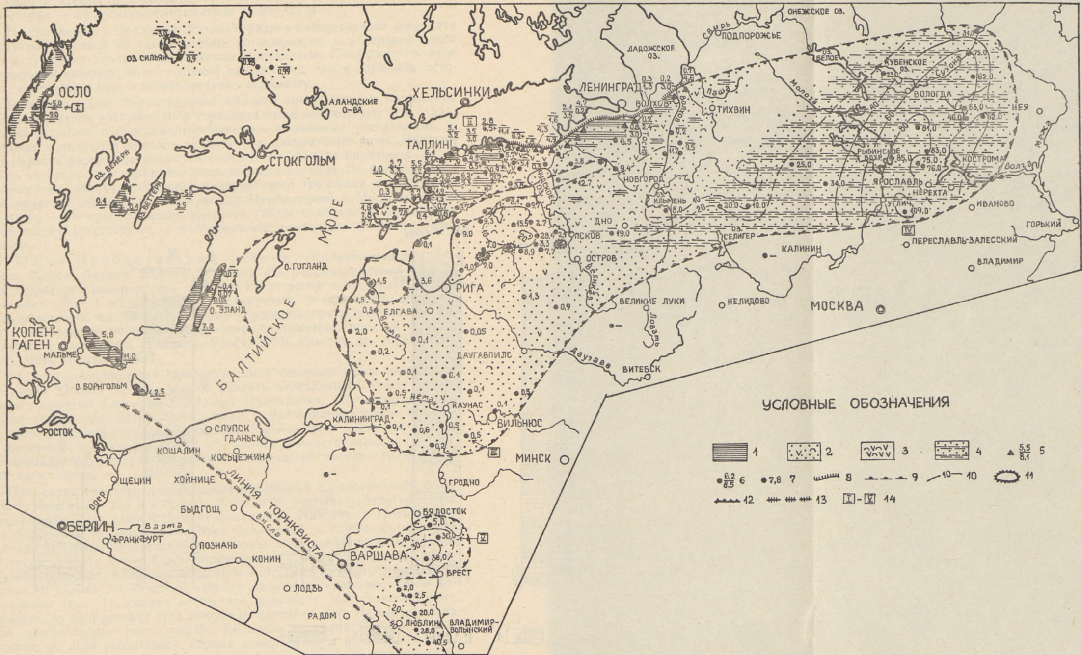
Рис. 1. Литолого-фациальная карта раннего тремадока Восточно-Европейской платформы. 1 — граптолитовый аргиллит; 2 — кварцевый песчаник или алеврит с обломками брахиопод; 3 — брахиоподовый ракушечник (оболовый фосфорит); 4 — чередование песчано-глинистых пород; 5 — обнажения (в числителе мощность граптолитовых аргиллитов, м; в знаменателе — оболовых песчаников); 6 — буровые скважины, то же, м; 7 — буровые скважины, мощность оболовых песчаников (или песчано-глинистых пород), м; 8 — Балтийско-Ладожский глин; 9 — современная граница распространения нижнетремадокских отложений; 10 — изопакеты, м; 11 — Валмиера-Мыинисте-Локновские выступы кристаллического фундамента; 12 — надвиг на платформу; 13 — линия Торнквиста; 14 — разрезы (см. рис. 2).