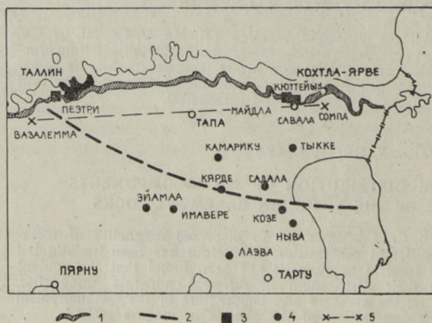
Рис. 1. Схема расположения обнажений и буровых скважин. 1 полоса выходов кукрузеского горизонта (северная эрозивная граница распространения отложений), 2 условная южная граница бассейна горючих сланцев, одновременно показывающая простирающие отложения с одинаковой стратиграфической полнотой их развития, 3 обнажение, 4 буровая скважина, 5 линия схематичного профиля, приведенного на рис. 3.

Для конкретного рассмотрения вопросов стратиграфии кукрузеского горизонта в данной статье используются разрезы трех буровых скважин — Савала, Тыкке и Камарику, первая из которых расположена в районе Кивиили, вблизи южной границы выходов кукрузеского горизонта (Эстонское месторождение горючих сланцев), а две остальные на юге, примерно в 40 км от выходов (Тапское месторождение) (рис. 1). Сква. Савала (Мянниль, 1966, рис. 11, 16, 17) пробурена Институтом геологии АН ЭССР со стратиграфической целью и ее керн можно рассматривать как гипостратотипический разрез ухакуского и