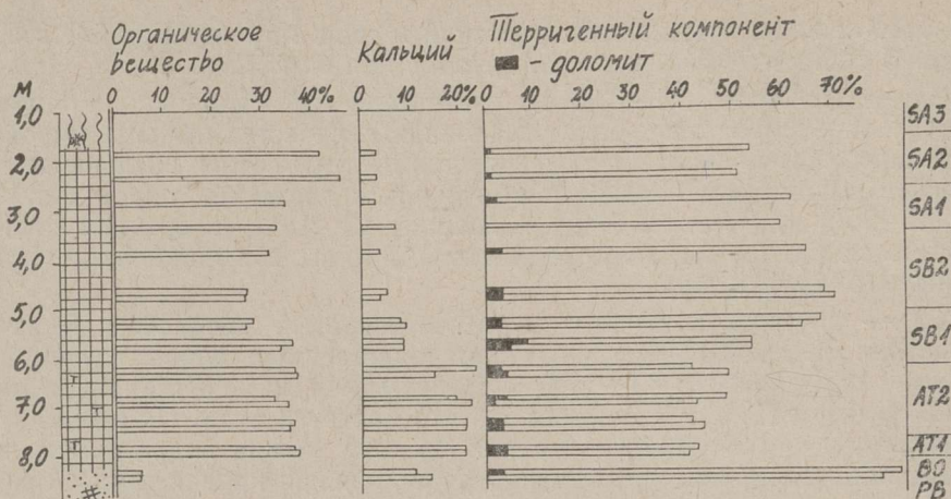
Рис. 3. Результаты химического анализа отложений скв. 4а. Fig. 3. Chemical content of sediments of reference site 4a.

Среди небольшого количества спор чаще встречается Bryales и Poly-podiaceae , единично — Sphagnum , Equisetum и Lycopodium clavatum .