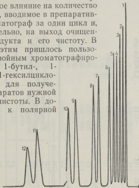
Рис. 1. Хроматограмма смеси 1- и 3-алкилциклопентенов. Колонка 1 (см. табл. 1), T 81^{\circ}\text{C} , скорость газа-носителя ( \text{N}_2 ) 55 \text{ мл/мин} . Пики: 1 — 3-метилциклопентен, 2 — 1-метилциклопентен, 3 — 3-этилциклопентен, 4 — 1-этилциклопентен, 5 — 3- n -пропилциклопентен, 6 — 1- n -пропилциклопентен, 7 — 3- n -бутилциклопентен, 8 — 1- n -бутилциклопентен, 9 — 3- n -амилциклопентен, 10 — 1- n -амилциклопентен, 11 — 3- n -гексилциклопентен, 12 — 1- n -гексилциклопентен.

Это обстоятельство оказывает существенное влияние на количество вещества, вводимое в препаративный хроматограф за один цикл и, следовательно, на выход очищенного продукта и его чистоту. В связи с этим пришлось пользоваться двойным хроматографированием 1-бутил-, 1-амил- и 1-гексилциклопентенов для получения препаратов нужной степени чистоты. В дополнение к полярной