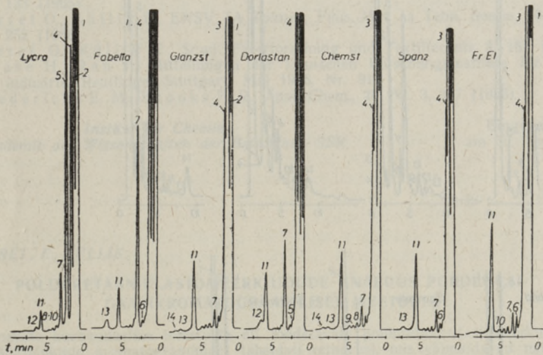
Abb. 2. Chromatogramme der Pyrolyseprodukte der Polyurethan-Elastomere, abgesondert mit der DMS-Säule.

ermöglichen, unter den betrachteten Elastomeren drei Elastomere direkt zu bestimmen. Die übrigen vier haben ähnliche Chromatogramme (Abb. 2, Tab. 5) und bedürfen einer detaillierteren chromatographischen Analyse.