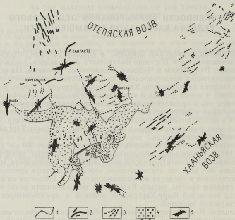
Рис. 1. Геоморфологическая схема Карулаской возвышенности: 1 — граница возвышенности; 2 — формы активного ледника (друмлины, конечные морены); 3 — унаследованно-ориентированный рельеф мертвого льда; 4 — беспорядочно расположенный холмистый рельеф мертвого льда: а — холмы и гряды с моренной покрывкой, б — камы; 5 — ориентировка галек в морене.

Согласно геоморфологической схеме (рис. 1) Карулаской возвышенности и территорий соседних гляциодепрессий, формы рельефа в зависи-