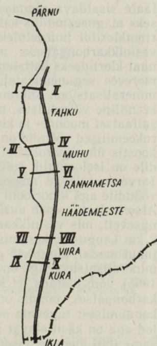
Joon. 1. Uuritud rannikuala skemaatiline plaan. Rooma numbrite paaridega on märgitud hüdrogeoloogiliste profiilide kohad.

Aastail 1967—1968 uuris autor pinnasevee keemilist koostist Eesti NSV edelarannikul Pärnust Iklani 2,5—3 km laiusel rannikuribal, mille mandripoolseks piiriks olid rannikuga paralleelselt kulgevad luiteahelikud. Uuritud rannikuriba (joon. 1) asub Pärnu madalmiku lõunaosas 0—4 m absoluutsel kõrgusel. Enamasti langeb siin maapind aeglaselt mere poole (kalle kuni 1 m/km), kohati aga, nagu Tahku, Viira, Kura jt. külade juures, tõuseb maapind juba rannast 100—200 m kaugusel 1—2 m üle merepinna (joon. 2). Pinnas koosneb kõnesoleval rannikuribal kobedatest kvaternaarsest setetest, mis kuuluvad holotseeni ja pleistotseeni. Aluspõhjaks neile on devonijastu pärnu, naroova või aruküla lademe settetikivimid. Kvaternaarse setete koostis on siin väga vahelduv nii horisontaalses kui ka vertikaalses suunas. Setete paksus rannikuriba põhjapoolses osas kuni Treimanini kõigub