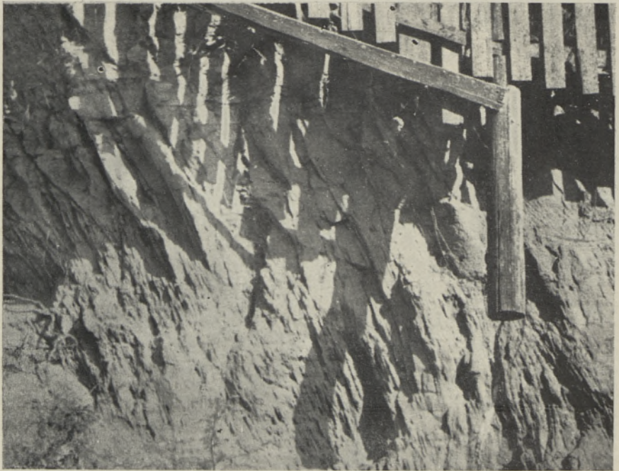
4. Сильно трещиноватые девонские песчаники на левом склоне р. Эмайыги в г. Тарту