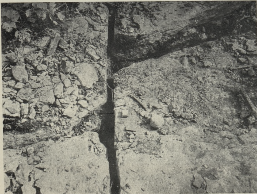
2. Открытые тектонические трещины в русле р. Пада у д. Самма.