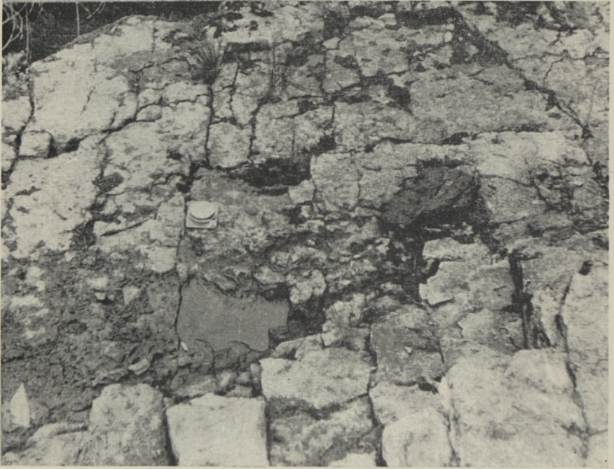
3. Густая тектоническая трещиноватость (зона дробления?) у водопада Лангезоя.