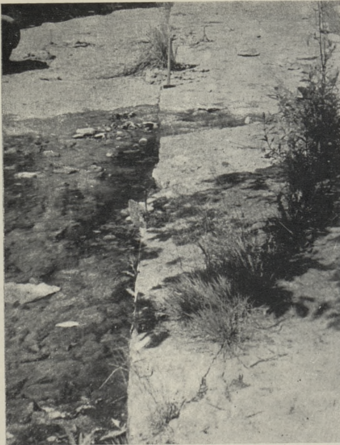
1. Тектонические трещины в долине р. Лообу, у водопада Исавески.