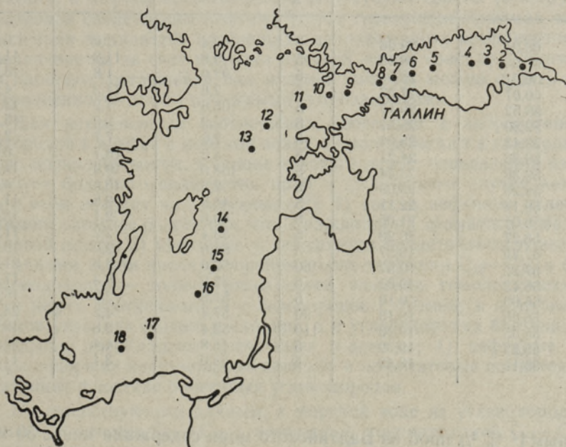
Рис. 1. Схема расположения станций, откуда брали пробы морской воды

Анализ проб с 18 международных станций, расположенных по т. н. вековому разрезу — десять в Финском заливе и восемь в открытой части Балтийского моря (рис. 1, таблица), показал, что концентрации углево-