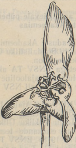
Joon. 1. Mugulbegoonia vili.

Begooniad on ühekojalised ühesugu-liste õitega taimed. Igal taimel on nii emas- kui ka isasõisi. Emasõitel on tupp-lehti 2, kroonlehti 4—6. Sigimik on alumine ja kolmetine, emakakaal vaba, emakasuu kaheharuline ja keerdunud. Vili on tiivu-line kupar (vt. joon. 1), seemneid väga palju ja pisitillukesed. Isasõitel on tupp-lehti 2, kroonlehti 2—6 ja tolmukaid palju.