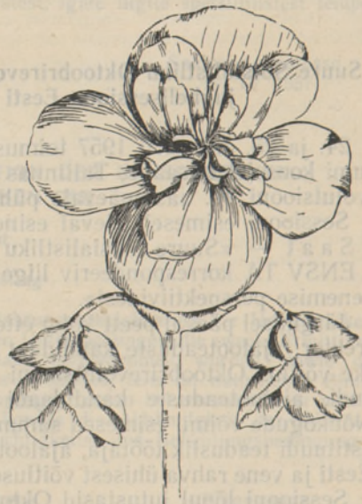
Joon. 2. Mugulbegoonia õite asetus.