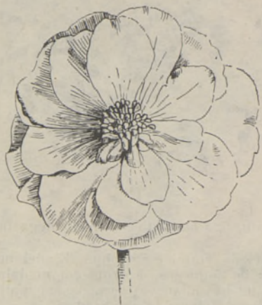
Joon. 3. Pooltädisõis.

3) Väärtuslike omaduste aretamiseks ja kindlustamiseks, eriti hästitäidetud ilusakujuliste pistõitega seemikute saamiseks kasutati hübriidseemikute korduvat ristamist.