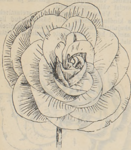
Joon. 5. Roosinupukujuline õis.

Kogu aretustöö jooksul valiti seemnekasvatuseks hübriidseemikute hulgast ainult