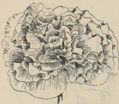
Joon. 6. Laineliste kroonlehtedega õis.

täidisõielisi vorme. Lihtõieliste tolmu kasutati ainult sel juhul, kui nende hulgas esines mõni erinev värvitoon või erinev vorm, näiteks tumedaleheline vorm, õite kollane või oranž värvus jne.