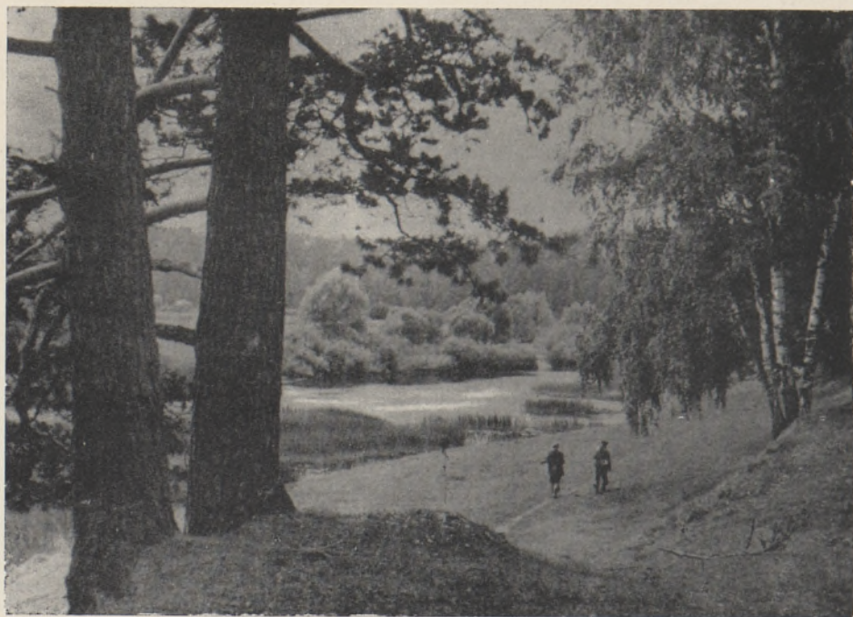
Foto 4. Puhkemaastik Moskva lähistel. (Каменский jt., 1963 järgi.)