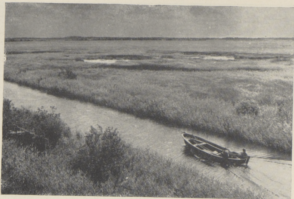
Foto 1. Maastik roostikuväljade ja Kasari jõe kanaliga Matsalu Riiklikul Looduskaitsealal.