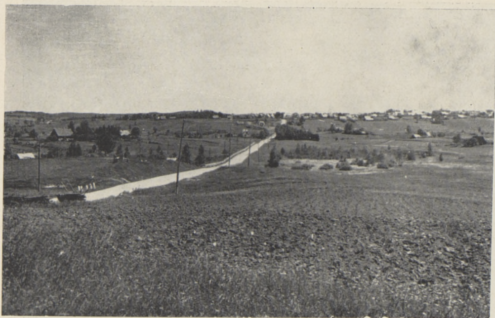
Foto 6. Kultuurimaastik künklikul moreenil Otepää lähistel.