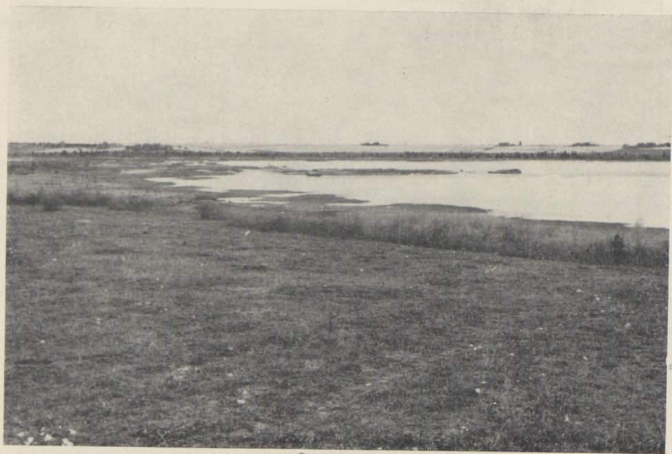
Foto 2. Maastik Soitsjärve ümbruses Vooremaa maastikulisel keelualal.