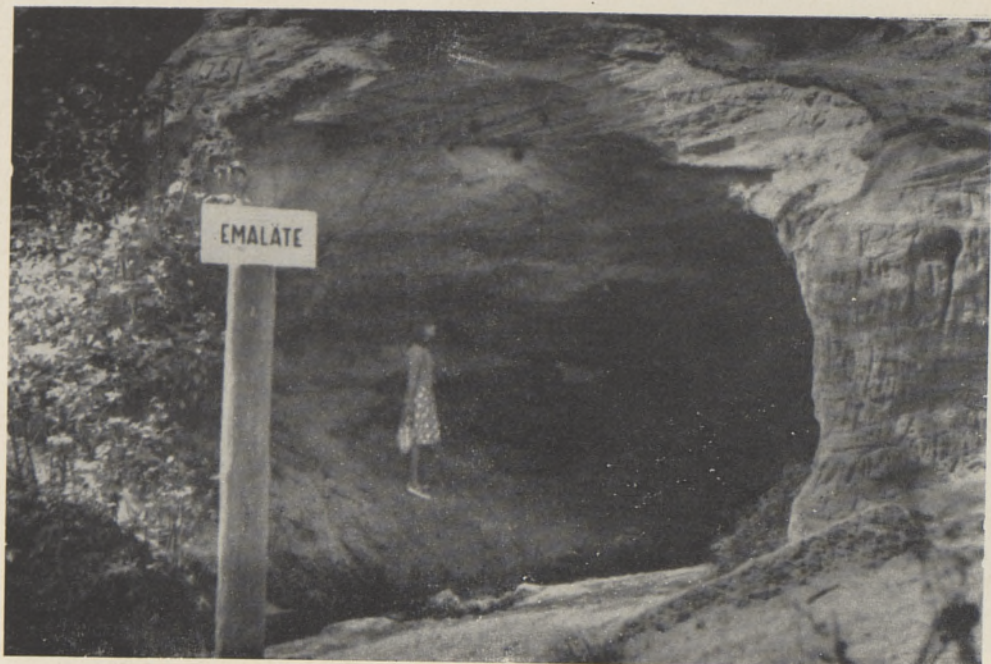
Foto 5. Emaläte — loodusemälestusmärk Ahja jõe ürgoru maastikulisel keelualal.