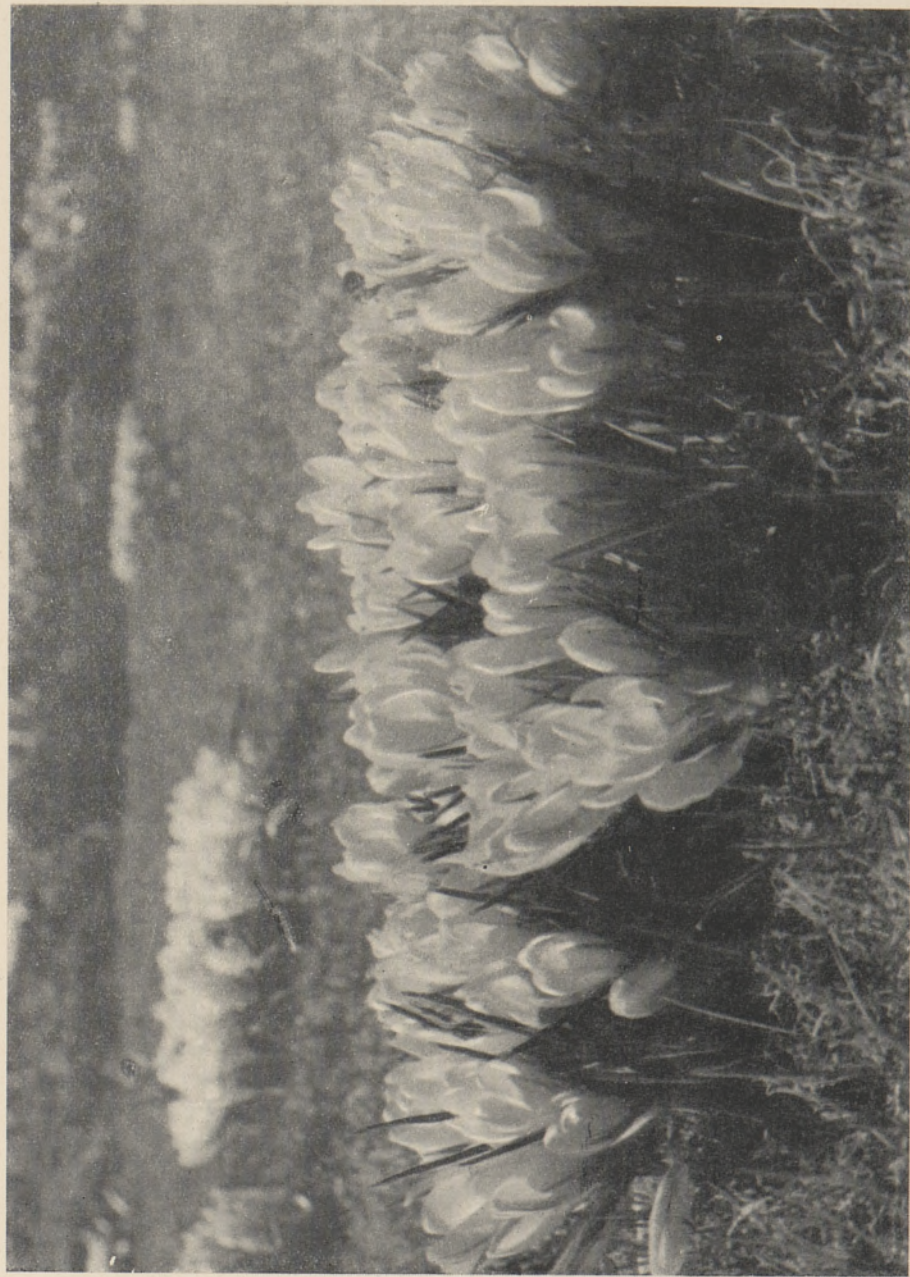
Foto 2. Valge krookuse ( Crocus hybridus hort. ) rühm murus 1958. a.