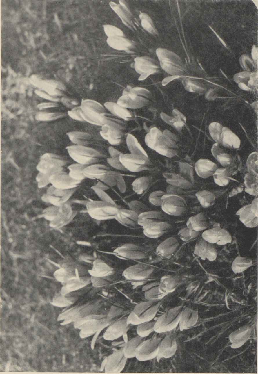
Foto 3. Kollase krookuse ( Crocus aureus Trautw.) katserühm murus 1955. a.