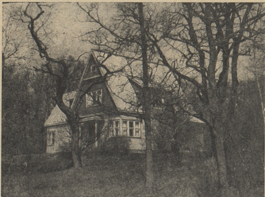
Foto 5. Puhtu ornitoloogiajaama hoone.

Kõigepealt on siin rida massiliselt esinevaid läbirändajaid, kes Puhtule annavadki tema «näo». Selliste liikide hulgas on kevadrändel eriti huvita-