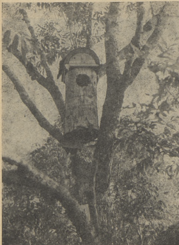
Foto 6. Jääkoskla ( Mergus m. merganser L.) kunstlik pesapaik Puhtu rannikul.

Sadadesse tuhandetesse ulatub Suures väinas kevad- ja sügisrändel viibivate merivartide arv. Märkimisväärne on Puhtu kaudu kevadel ja sügisel läbirändavate järve- ja punakurk-kauride hulk; hommikutundidel võib siis näha kaure küll üksikult, küll väikeste salkadena pidevalt üle lendamas, nii et nende mujal vähe esinevate lindude arv siin paari rändetunni jooksul ulatub sadadesse.