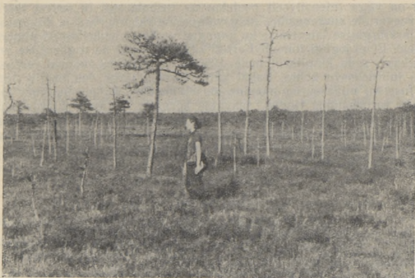
Foto 1. Turbasambla pealekasvamise tõttu hukkunud männid Kerreti rabas (7. VI 1956).

Kliimaperioodide vaheldumine ja soo areng on põhjustanud ilmseid muutusi ka rohttaimede ja sammalde levikus. Kõige vanemates turbakihtides, mis on ladestunud kuival ja soojal boreaalsel kliimaperioodil, leidub rohttaimede tolmuteri suhteliselt palju, kusjuures enamuses on kõrreliste ja lõikheinaliiste tolmuterad. Vähe esineb turbasammalde ja sõnajalaliste eoseid. Niiske ja sooja atlantilise kliimaperioodi taimkatte objektiivseks iseloomustamiseks ei piisanud meil kahjuks andmeid, sest tolal ladestunud turbakihist võeti vaid üks proov ja selle järgi otsustades on viimati nimetatud kliimaperioodile iseloomulik tunduv rohttaimede vähene mine. Kuival ja jahedal subboreaalsel kliimaperioodil, millal soo areng jõudis siirdesoostaadiumi, tõusis jälle rohttaimede tolmuterade osatähtsus, millest kõige enam esineb kõrrelisi. Märgatavalt suureneb turbasammalde eoste sisaldus. Subatlantilisel kliimaperioodil, millal soo on arenenud rabaks, on rohttaimedest esikohal juba kanarbikulised ja hundinuialised. Eostaimedest saavutavad oma esinemismaksimumi turbasamblad ja lehtsamblad, kuna sõnajalalisi esineb vähem kui kunagi varem.