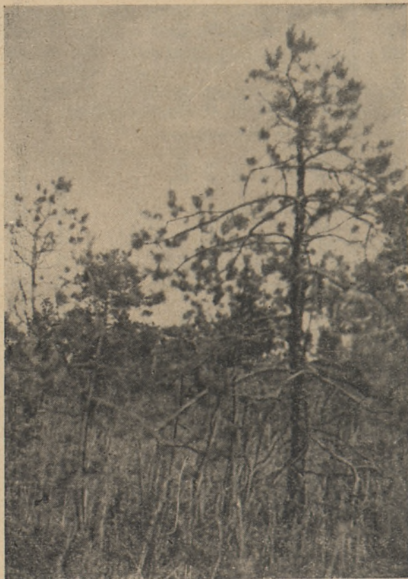
Joon. 3. Kidurate mändidega kaetud kuivendamata siirdesoo Väätsa metskonnas kv. 42.

Teiseks levinud puuliigiks siirdesoodel on sookask. Kuna proovialadena võetud sookase puistud olid tekkinud juba kuivendatud aladele, siis ei olnud võimalik võrrelda puude juurdekasvu kuivendamisele eelnenud ja kuivendamisele järgneval perioodil. Sookase nõrka reageerimist kuivenda-