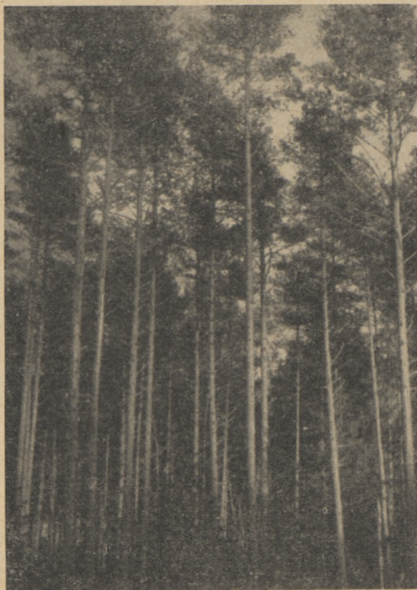
Joon. 4. Männipuistu kuivendatud siirdesool Tipu metskonnas kv. 121.

Sookase nõrgemat reageerimist kuivendamisele võrreldes männiga võisime näha ka männi enamusega proovitükkidel, kus puistu koosseisus esines sookask. Kui võrrelda keskmiste puude diameetreid erinevatel kaugustel kraavist, näeme, et männi diameeter suurenes seoses kuivendamisega