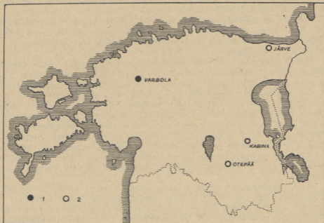
Joon. 4. Lääne-balti (1) ja ida-balti (2) tüüpi levik Eestis XIV—XVIII saj.

Mis puutub liivi koljudesse, siis meile tuntud koljud XI sajandi kalmetest Koiva (Gauja) jõe alamjooksu rajoonides 34 erinevad eesti omadest ajukolju väiksemate mõõtmete poolest; eriti nende kõrgus on väiksem kui eesti koljudel. Muus on neil sarnasus meie koljudega, eriti oma pikapealisesuse, kitsa ja kõrge nāo ning kitsa nina tõttu. Idapoolsetes naaberajoonides seda tüüpi ei esine.