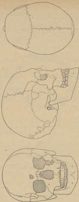
Joona 2. Mehe kolju XIV sajandist 15. saj. Jõgeva kihikandidest (vanusid nr. XIII 4).