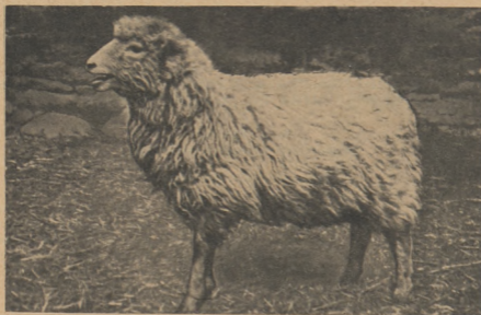
Рис. 1. Типичная эстонская неуплученная местная овца с неоднородной грубой шерстью. Живой вес 36 кг.

В буржуазной Эстонии овцеводство было второстепенной отраслью животноводства. Местных овец пытались улучшить путем поглотительного скрещивания с шропширскими и шевииотскими баранами.