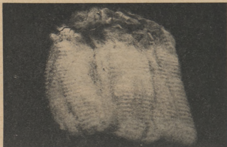
Рис. 11. Однородная полутонкая (56/50 качества), с правильными извитками шерсть эстонской темноголовой овцы.

Данные обследования пород овец, проведенного Институтом животноводства и ветеринарии АН ЭССР, показывают, что длина шерсти,