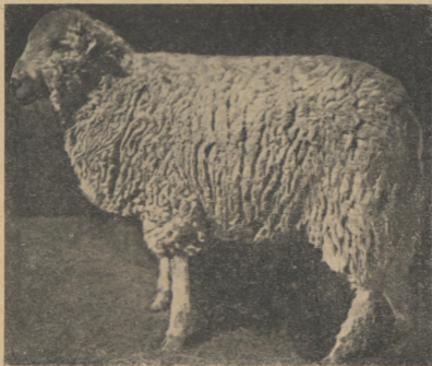
Рис. 6. Эстонская белоголовая овцематка, полученная при разведении «в себе» овец желательного типа. Живой вес 64 кг; годовой настриг шерсти 4,2 кг.

Как видно из таблицы 9, по данным бонитировки 1951 и 1952 годов, средний настриг шерсти баранов в возрасте свыше 2 лет составил 3,2—3,4 кг, а средний настриг шерсти маток в том же возрасте — 2,4—2,5 кг. Эти средние данные о настриге шерсти, полученные при