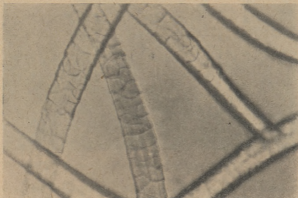
Рис. 9. Шерстинки однородной полутонкой шерсти под микроскопом (ясно виден чешуйчатый слой).

нов имеют однородную полутонкую шерсть; из чистопородных темно-головых маток полутонкую шерсть имеют 56,9—71,7%. Из чистопородных белоголовых баранов однородную полутонкую шерсть имеют 72,0—84,5%, а из маток 70,7—77,1%; 59,1—74,2% темноголовых помесных