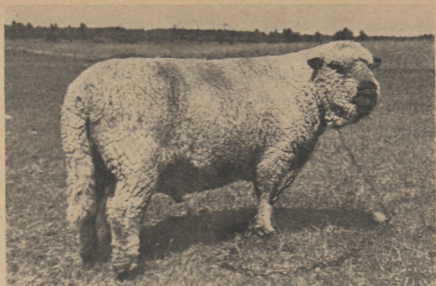
Рис. 4. Шропширский чистопородный баран (улучшатель эстонских темноголовых овец) с однородной, полутонкой шерстью. Живой вес 80 кг, годовой настриг шерсти 4,5 кг.

Как известно, основными компонентами эстонских белоголовых овец являются местные овцы, шевиоты, овцы ромни-марш и немецкие белоголовые овцы. Таким образом, промеры эстонских белоголовых овец можно было бы сравнить с промерами пород шевиотской, куйбышевской и ромни-марш (таблица 6).