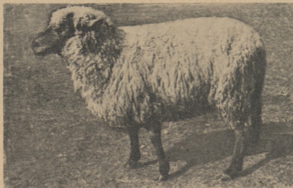
Рис. 2. Эстонская темноголовая овцематка, полученная при разведении «в себе» темноголовых овец желательного типа.

В таблице 2 приведена разбивка бонитированных овец по классам. Большинство бонитированных темноголовых баранов (84,4%) относится