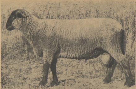
Рис. 5. Эстонский темноголовый баран, полученный при разведении «в себе» овец желательного типа. Живой вес 80 кг, годовой настриг шерсти 4,6 кг.

Как известно, при лучших условиях кормления и содержания мы получаем более крупных и сильных баранов. Более крупные, жизнестойкие бараны передают свои качества также потомкам. Поэтому за индивидуальным развитием баранов необходимо следить уже начиная с рождения. Следует производить оценку и взвешивание баранов в различные этапы жизни: в возрасте 4, 8, 12 и 18 месяцев, так как эти этапы являются показательными для развития организма и его приспособления к внешним условиям.