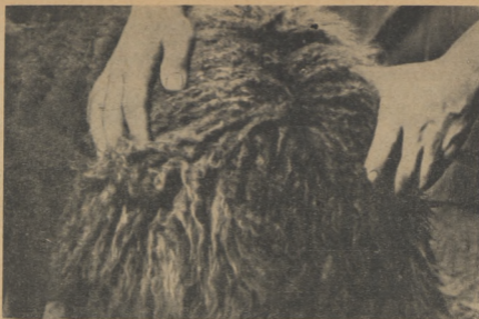
Рис. 7. Грубая, неоднородная шерсть неулучшенной местной овцы.

закончены и у которых на ляжках имеется неоднородная шерсть (ость и пух), то на основании опыта, приобретенного Институтом животноводства и ветеринарии АН ЭССР при обследовании пород овец, следует отнести овец-помесей, имеющих на бочке шерсть 50 качества, к полугрубошерстным, так как на ляжках этих овец шерсть неоднородна и полугруба.