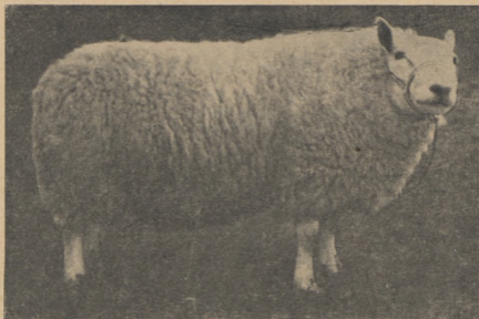
Рис. 3. Эстонская белоголовая овца желательного типа. Живой вес 73 кг, годовой настриг шерсти 4,7 кг.

К классу элита в 1951 и 1952 годах было отнесено 3,9—4,9% белоголовых маток. Белоголовые помесные матки относятся в своем боль-