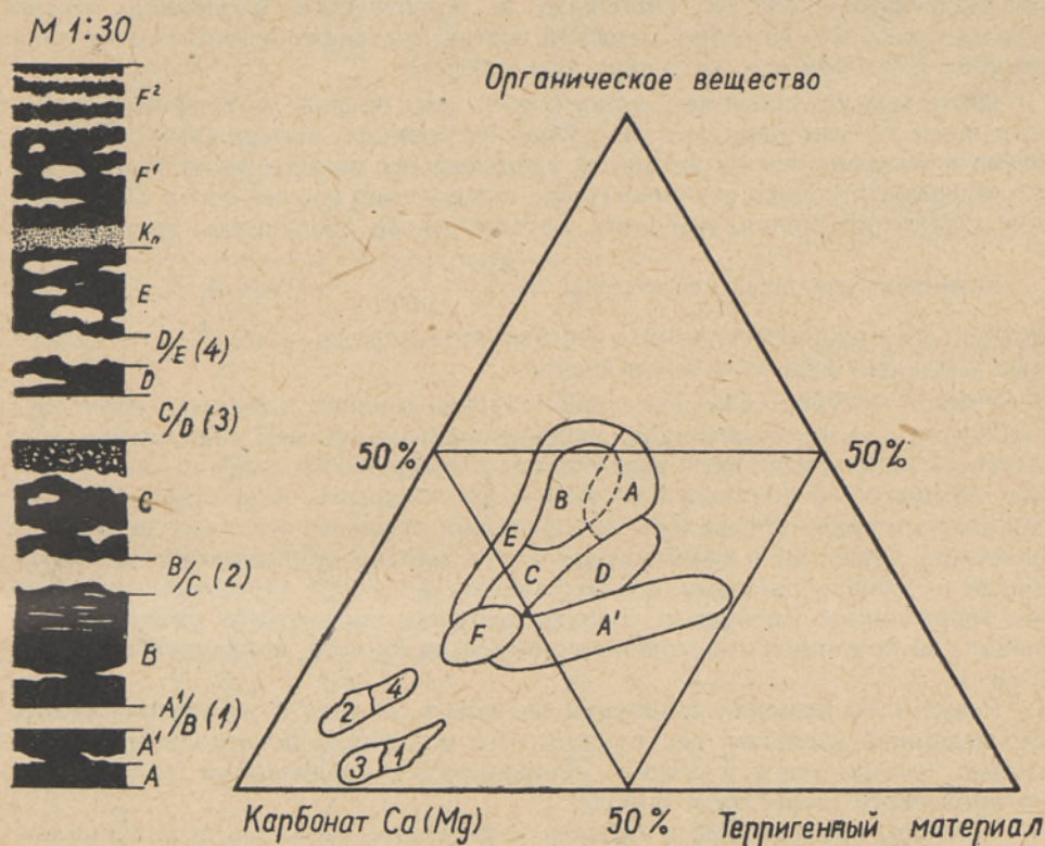
Фиг. 2. Содержание органического вещества, карбоната Ca(Mg) и терригенного материала в прибалтийских горючих сланцах и переслаивающихся с ними известняках. А, А', В, С, D, E, F — сланцевые слои; А'/В(1), В/С(2), С/Д(3), D/E(4) — породные прослои.

До сих пор в составе горючих сланцев и переслаивающихся с ними известняков выделяют три составные части — органическое вещество,