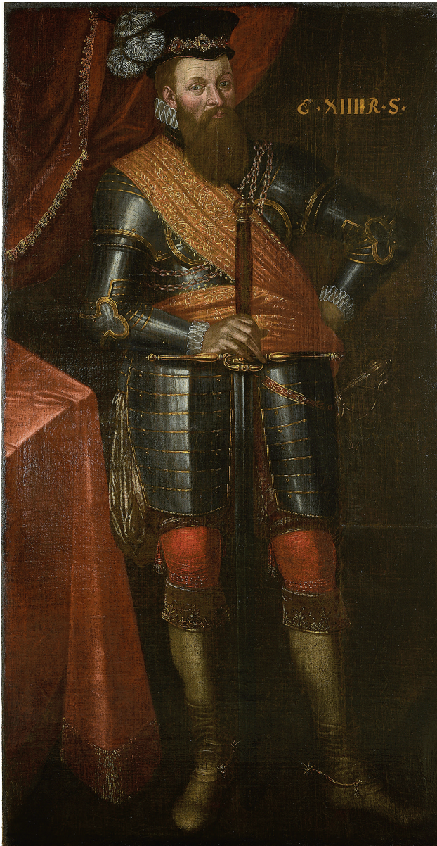
Joonis 1. Rootsi kuningas Erik XIV (1560–1568). Tundmatu kunstniku maal, 1640. aastad. Tallinna Mustpeade vennaskonna kogu. TLM.