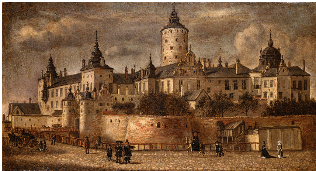
Joonis 2. Stockholmi kuningaloss. Govert Camphuyseni õlimaal „Tre Kronor“ 1661. aastast. Stockholmi linnamuuseum.

Allutades end Rootsile, said tallinlased ja teised eestimaalased selgelt aru, et tegu on pöördelise sündmusega maa ajaloos. Meie teame tagantjärele tarkadena, et Tallinna rae ja kodanikkonna ning Harju-, Viru- ja Järvamaa aadli otsuse tulemusel läks Põhja-Eesti peaaegu 150 aastaks Rootsi riigi koosseisu ja selle üpriski pika perioodi jooksul kujunes keskväimu ning tema ülemerevalduse seisuslike korporatsioonide vahel välja õigussuhe, mis mõjutas paljudes aspektides Eestimaa elukorraldust 19. sajandi lõpuni välja. Kuid suvel 1561 said tallinlased ja linnas moskvalaste eest redus olevad aadlikud tulevikule mõelda abstraktselt, ehkki täis lootust ja ootust, et tulemas on paremad ajad. Neil päevil oli kohalike korporatsioonide keskseks mureks nende senise õigusliku ja majandusliku seisundi säilimine. Oldi veendunud, et selle peab linnale ja provintsile tagama Rootsi kuningas (joonis 2). Selleks pidi monarh kinnitama privileegid ja teised õigusaktid, mis varasemad valitsejad oli aegade jooksul linnale ja aadlile andnud.