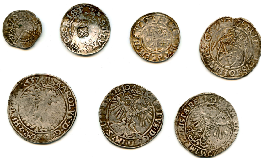
Illustratsioon 5. Eametsa leiu müntid, tpq 1557. Tallinna Ülikooli arheoloogia teaduskogu, AI 8557.

Seletamatul kombel pole ei Eesti ega ka Läti aaretest teada pärandiloendites üsna arvukalt nimetatud schreckenberger 'eid, v.a üks inglükross 2020. aastal Põhja-Pärnumaalt avastatud Eametsa leiust ( tpq 1557). 176 Küll liikus meil aga umbes sama suuri ja raskeid Madalmaade vlieger 'eid, mida aga, vastupidi, pole märgitud pärandiloendites. Juba mainitud Eametsa leius olid koos inglükrossi, paari kohaliku veeringu ja viie killin-giga neli vlieger 'it (vt illustratsioon 5). 177 Koguni 15 vlieger 'it oli Kabala (Pilistvere II) aardes ( tpq 1559), neli (teistel andmetel üheksa) teadmata leiukohaga aardes ( tpq 1556), kaks eksemplari nii Uulu ( tpq 1556) kui ka Kurevere ( tpq 1572) leius ning üks Võnnu I aardes ( tpq 1557). 178 Ka Lätis on vlieger 'eid Liivi sõja eelsetes ja sõja algusaja mündiaaretes üsna sageli ette tulnud. 179 Seda arvesse võttes tundub tõenäoline, et ka vlieger 'eid kutsuti Liivimaal schreckenberger 'iteks.