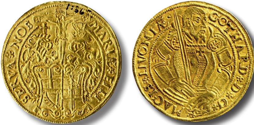
Illustratsioon 2. Haapsalust leitud Gotthard Kettleri topeltkulden. Eesti Ajaloomuuseum, AM 1:365.