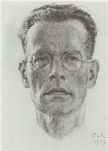
Autoportree. Joonistus, 1937.