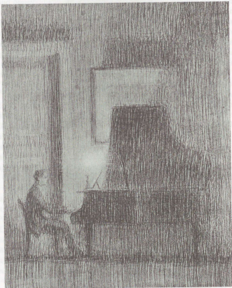
Valgusetüü. Väriline kriit, ca 1910.

See teeb tema püüetud realistlikumaks. Sõja ajal pühendas kunstnik oma loomisele kunstide kõrgkoolis, kus aastail 1940-1943 oli õpetajate kabinetti ja pärast sõda skulptorina muudis suuna. Tema teoste seas on õpetajate kirjutatud: "Partei ja ametkondlised ühised ühised" ja "Kõrgkooli õpetajate seisukoha tihedalt kinnistatud ühised ühised".