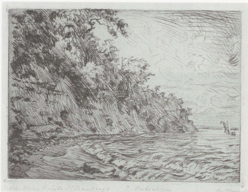
Eesti rannik. Rannamõisa. Ofort, 1921.