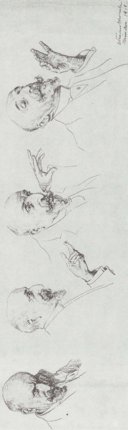
Toddy pajatab. Riia maalikunstmiku Ernst Tode neli portreed. Pliiats, 1918.