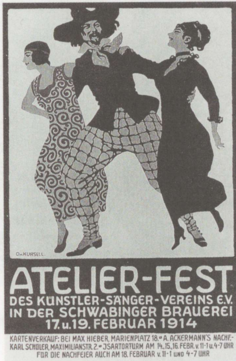
Ateljööpidu. Plakat, 1914.