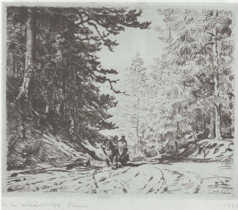
Eesti luidetes. Ofort, 1921.