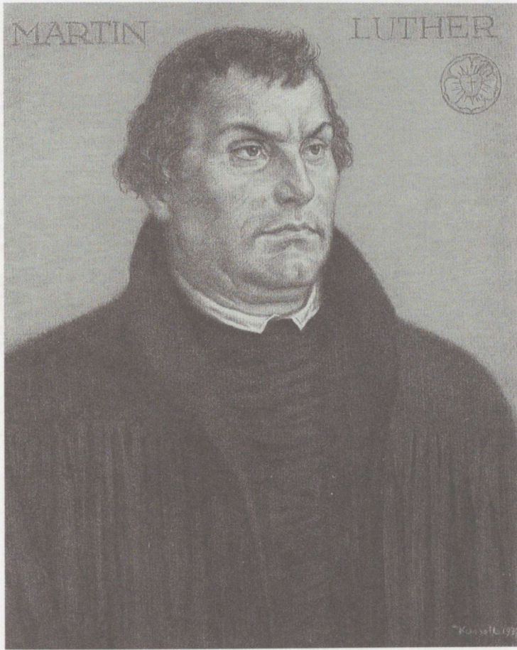
Martin Luther. Õli, 1938.