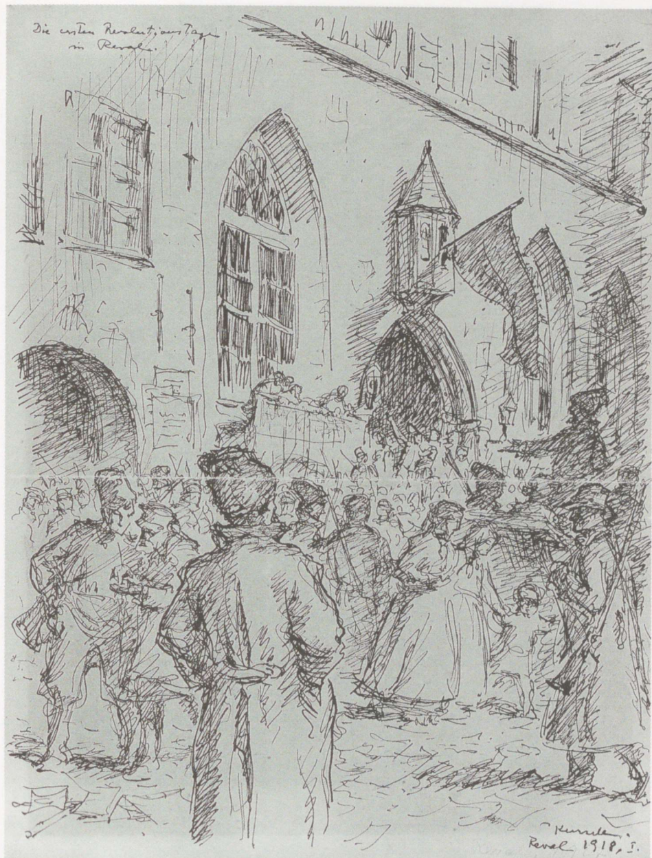
Bolševistliku revolutsiooni teine päev Tallinnas. Tušš, 1918.