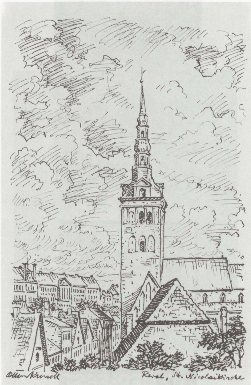
Tallinn. Niguliste kirik. Tušš.