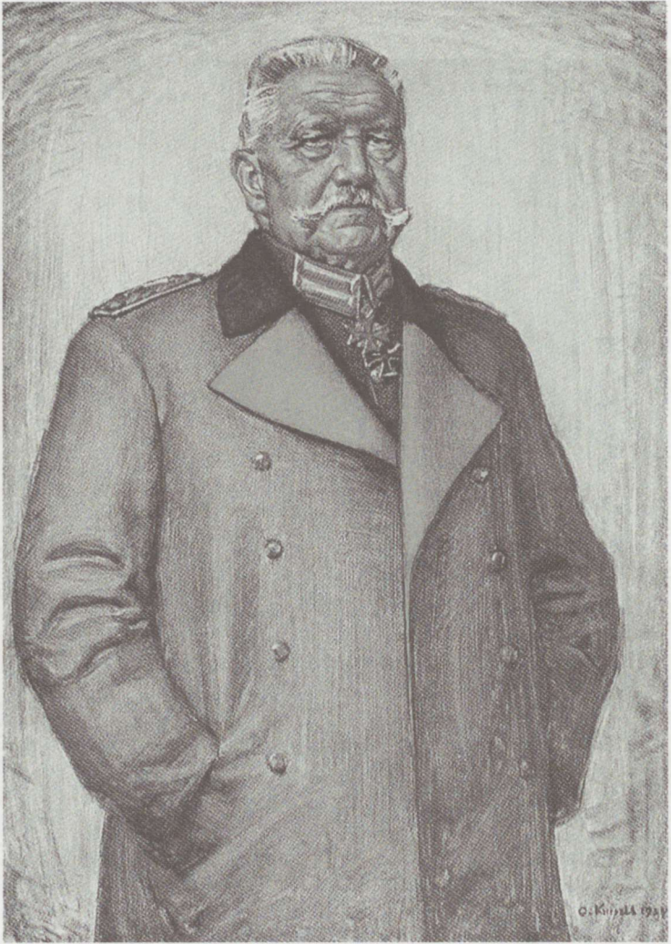
Riigipresident P. v. Hindenburgi portree. Õli, 1934.