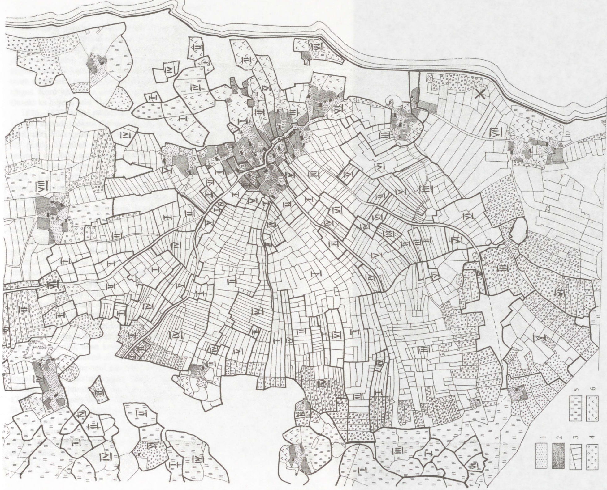
Joon. 3. Valma küla 1826–1827. aastal (EAA, f. 2072, n. 3, s. 10d järgi). Peenema joonega talude põllutükkide piirid, jämedama joonega talurühmade valduste piirid. Talude rühmad: I Tehase talud, nr. 51–54; II Puskari talud, nr. 61–64; III Lellepi talud, nr. 55–60; IV Miku talud, nr. 69–72; V Kurika talud, nr. 47–50; VI Piirma talud, nr. 67–68; VII Puskari hajatalud, nr. 65–66; VIII Kõlli hajatalud, nr. 45–46. Rätsepa (nr. 73) ei kuulu talurühmade koosseisu. Sihvre (nr. 34–35), Tossu (nr. 36), Kipre (nr. 37) ja Ressare (nr. 38–39) asuvad kaugemal ja jäid jooniselt välja. Numbrid tähistavad vastava talu elumaja. Ristiga on märgitud neoliitilise asukoht. Tingimärgid: 1 õu, 2 aiamaa, 3 põld, 4 võsapõld, 5 heinamaa, 6 koppel.