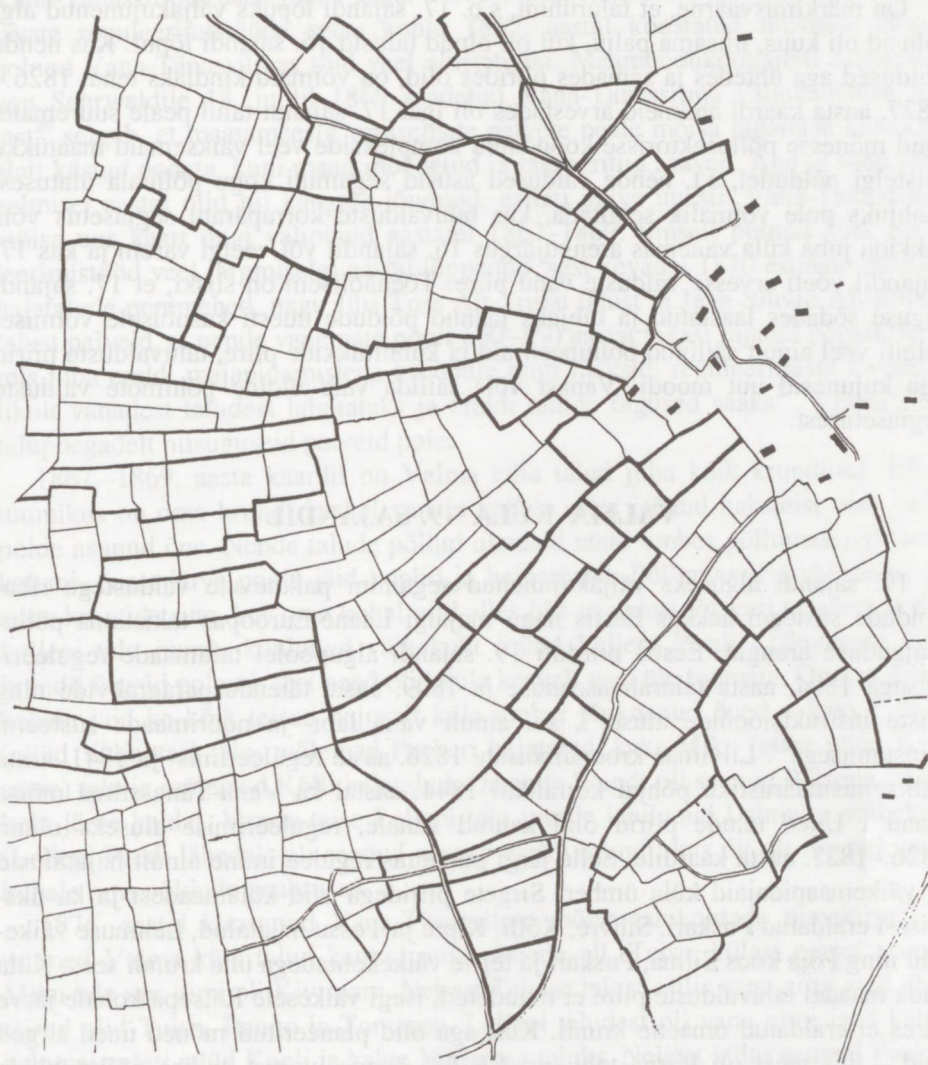
Joon. 4. Valma küla suurte põllutükkide piirid 17. sajandil enne talude jagunemist. Jämedama joonega on algtalude valduste arvatavad piirid. Need kattuvad joonisel 3 jämedama joonega tähistatud talurühmade valduste piiridega. Autori rekonstruktsioon 1826.–1827. aasta kaardi alusel.

juba 17. sajandi algupoolel (või ka varem?), enne kui talusid hakati 17. sajandi lõpupoolel ja 18. sajandil jagama. Eriti peab rõhutama, et 17. sajandi lõpuks kujunenud kuue talu, hilisemate talurühmade valduste piirid kulgesid just mööda nende suurte tükkide piire. Väiksemad valdustükid koosnesid 1–4 osast, suurematel kompaktsel valdustel oli suuri põllutükke märgatavalt rohkem. Ka need kohad, kus arvatavad põllutükkide piirid olid kaduma läinud, asusid kõik ühe talurühma valduste sees.