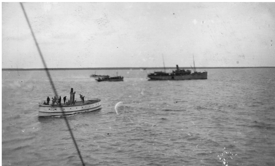
Kalevipojalt traaleritega dessantnike maabumine Luuga lahes 1919. a mais.

15. mai hommikul jõudsid Narva lahte vahilaev Laene (peal Wambola dessantkomando), Kalevipoeg ja Rasson ning koos Lembitu ja traaleritega asuti Luuga lahe poole teele. Kohe teatas Pitka Laidonerile, et laevastik on kohal ja alustab dessandiga. 93 Laidoner pidi sellest omakorda teavitama 1. diviisi ülemat, kel samuti tuli pealetungile asuda. Luuga jõe suudmes pandi dessantlased traaleritele ja väiksematele paatidele. Seekord ei antud laevadelt rünnakut ettevalmistavat suurtükiltuld. Binokliga jälgiti ümbrust ja avastati liikuv vaenlane, kes laevade pihta tuld ei avanud. Pitka läks riskile, eeldades, et punaväelaste arvates on tegemist nende enda laevastikuga. 94 Seega viskasid MDP mehed kaldale lähenedes välja köied ja