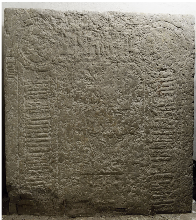
Joon 5. Hauaplaadi fragment peauksest lõuna pool.

menti. On raske öelda, kas teise vapi näol on tegemist keskse vapi pealishisega või on uurendatud vapp lisatud hiljem ja märgib mõnd hauaplaadi järgmist omnikku. Teatavasti oli hauaplaatide korduvkasutus kesk- ja varauusajal väga levinud nähtus.