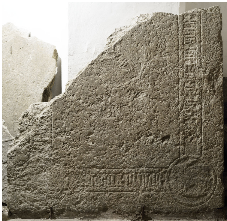
Joon 7. Hauaplaadi fragment eeskoja lõunaseina ääres.

Kuna plaadi murdekoht jookseb diagonaalselt, on säilinud suurem osa paremal küljel olnud tekstivööndist, samuti alumine ots. Vasaku külje tekstist näeb see-