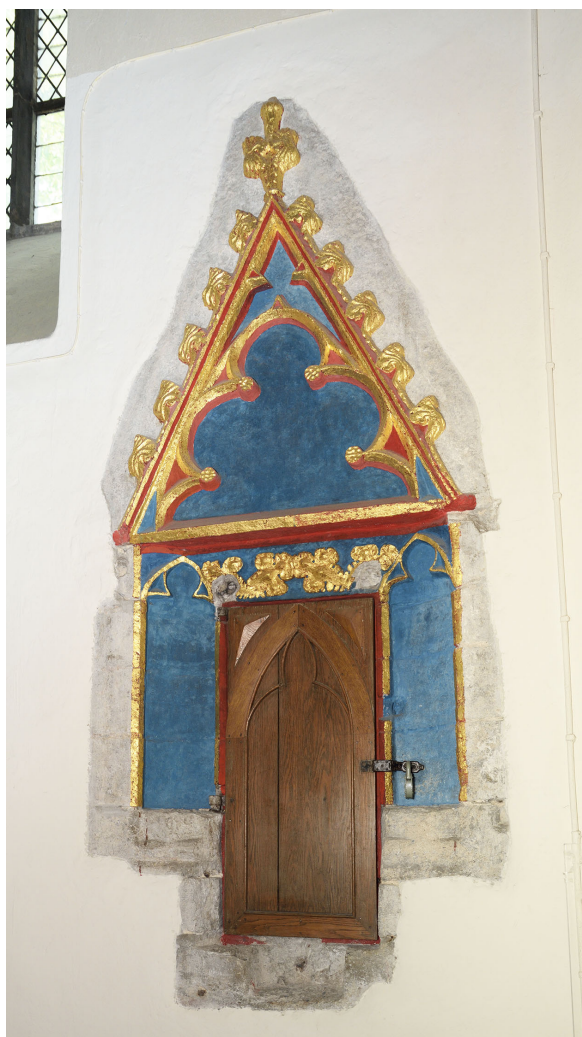
Joon 3. Sakramendinišš (15. sajandi I pool) kooriümbriskäigu kaguseinas, mille läheduses olid tõenäoliselt Sakramendi altar ja üks Püha Anna altaritest.