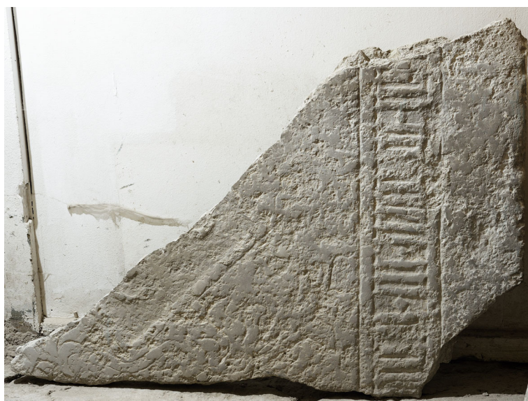
Joon 8. Eelmisega samast plaadist pärit fragment eeskoja lõunaseina lähedal. Foto S. Stepaško.

Jällegi pole varasemad uurijad märganud, et samast plaadist on säilinud veel teinegi fragment (joon 8). See paikneb suurema plaadikatke läheduses, jäädes sellest paremale, ja on kaitse alla võtmata. 227 Murdejoont arvestades pärineb väiksem fragment plaadi vasakult küljelt, ent ei ulatu ülaotsani välja. Sellel võib näha osakest tekstivööndist, vapikilbi ülemist osa ja selle kohal looklevat uurendtehnikas lehtornamenti. Paraku pole ka kahe plaaditüki koos uurimisel õnnestunud tuvastada ei peremärki ega lugeda tekstist välja osi, mis aitaksid kindlaks määrata surmadaatumit või kadunukese nime. Võib üksnes loota, et teksti osas on tulevikus võimalik abi saada järjest arenevast pilditööstlustehnikast. Seni võib üksnes oletada, et sarnaselt eelmisele on ka see hauaplaat kuulunud mõnele Olevistesse maetud raehärrale.