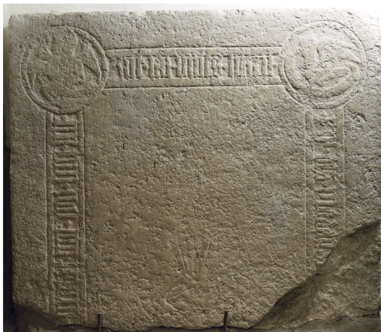
Joon 4. Hauaplaadi fragment peauksest põhja pool.

Kõige paremini säilinud poolikut hauaplaati võib näha peauksest põhja pool (joon 4). 217 Plaadist on säilinud ülemine pool. Selle nurgad on kaunistatud sõõri sees olevate evangelistide sümbolitega: vasakul tekstilindiga ingel (Püha Matteus) ja paremal tekstilindiga kotkas (Püha Johannes). Alamsaksakeelsest gooti