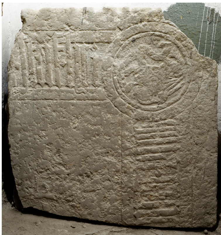
Joon 6. Eelmisega samast plaadist pärit fragment eeskoja lõunaseina ääres.

starf her (suri härra), seevastu alumisel küljel, kus peaks järgnema nimi, on tekst taas raskesti loetav. Eesnimi näib olevat ioha[n] , sellele järgneb poolik perekonnanimi, mis algab tähtedega velt või vest . Tiitel her osutab, et tegu on kas raehärra, vaimuliku või aadlikuga. Et peremärgiga vapikilp välistab aadliku ja et vaimulike hauaplaadid olid enamasti ladinakeelse pealiskirjaga, võib oletada, et plaat kuulus mõnele raehärrale.