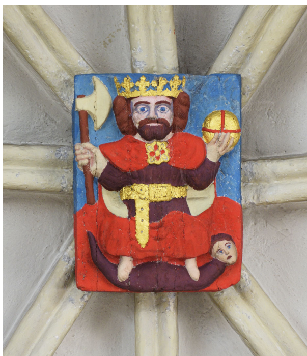
Joon 2. Püha Olavi kujutisega päiskivi (umbes 1425) koori idapoolseimas võlvikus, kus tõenäoliselt asus Püha Olavi ehk Hommikumissa altar.